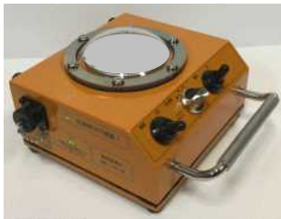
ヘリポート用着陸灯

防衛省様やJAXA様に納入しています。 4色+赤外線+リモコンも可能です。 大型機のジェットブラストやV-22オスプレイの風圧にも耐えます。